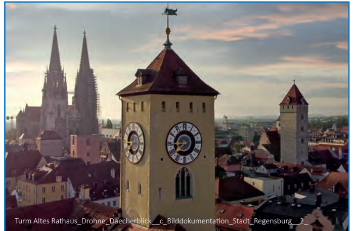
Turm Altes Rathaus_Drohne_Daecherblick_c_Bilddokumentation_Stadt_Regensburg_7

Anschrift: Emmeramsplatz 5, 93047 Regensburg Infos: https://www.thurnundtaxis.de/home